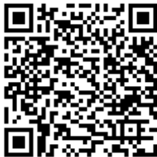
Código QR para validación en sede

Regulación CSV: Decreto 3628/2017 de 20-12-2017